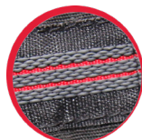
Antypoślizgowa taśma w pasie

MATERIAŁ: 35% bawełna, 65% poliester. Wytrzymała tkanina typu CANVAS. 13 kieszeni, w tym 1 zamykana na suwak. Praktyczne kieszenie monterskie. Kieszeń na telefon komórkowy zabezpieczona tkaniną odbijającą promieniowanie elektromagnetyczne. Wstawki z materiału stretch „4-way elastic” (rozciągliwość w 4 kierunkach) zapewniają elastyczność i wygodę podczas użytkowania. Wentylacja z siatki w zgięciu kolan. Wstawki odbłaskowe zwiększające bezpieczeństwo podczas pracy. Potrójne szwy. Dodatkowe wzmocnienie szwów w kroku. Innowacyjna regulacja szerokości w pasie za pomocą specjalnej konstrukcji z elastyczną taśmą. Antypoślizgowa taśma w pasie (po wewnętrznej stronie) zapobiegająca wysuwaniu się górnej części garderoby ze spodni. Oczko na klucze. Szlufka na młotek. 3 uchwyty na miarkę. Szlufki na pasek. Wzmocnione kieszenie, kieszenie na ochraniacze kolan oraz dół spodni materiałem (500D poliester) odpornym na przetarcia Krój „slim fit”. Modny i ciekawy design. Wszystkie identyfikacyjna. NORMA: EN ISO 13688.