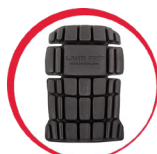
Ochraniacze kolan do spodni/ogrodniczek ochronnych