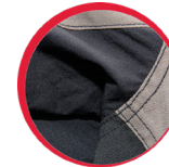
Wstawki z materiału stretch „4-way elastic”