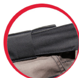
Innowacyjna regulacja szerokości w pasie