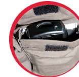
Ochrona przed promieniowaniem elektromagnetycznym