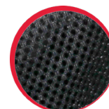
Wentylacja z siatki