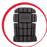
Ochraniacze kolan do spodni/ogrodniczek ochronnych

MATERIAŁ: 40% bawełna, 60% poliester, 270 g/m 2 . Pasy odbłaskowe zgodne z normą EN ISO 20471. Wysoka klasa widzialności: klasa 2. Podwójne szwy. 12 kieszeni, w tym 9 zapinanych na rzep. Kieszenie na ochraniacze kolan. Regulacja w pasie za pomocą guzików i gumki. Szelki z regulacją długości za pomocą zapięcia i gumki. Napy pokryte tworzywem chroniącym przed kontaktem z wodą. Wszywka identyfikacyjna. Kieszeń na telefon komórkowy. Wzmocnione kieszenie materiałem (600D poliester) odpornym na przetarcia. Potrójne szwy. Oczko na klucze. Szlufka na młotek. NORMA: EN ISO 13688, EN ISO 20471.