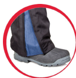
Regulacja szerokości nogawek

MATERIAŁ: Powłoka: 100% poliester 600D Oxford 200 g/m 2 . Ocieplina: 160 g/m 2 . Podszewka: tafta 50 g/m 2 . Wytrzymała, impregnowana tkanina pokryta PU. 7 kieszeni, w tym 4 zamykane na rzep. Regulacja szerokości w pasie za pomocą gumki. Szlufki na pasek. Odblaskowe elementy. Regulacja szerokości nogawek u dołu za pomocą suwaka. NORMA: EN ISO 13688.