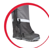
Regulacja szerokości nogawek