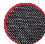
Wzmocnienia materiałem odpornym na przetarcia