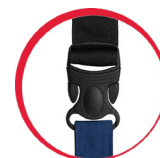
Specjalna konstrukcja kłamek zapobiegająca jej zsuwaniu się