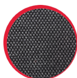
Wzmocnienia materiałem odpornym na przetarcia