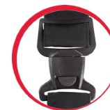
Specjalna konstrukcja klamry zapobiegająca jej zsuwaniu się