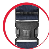
Specjalna konstrukcja klamry zapobiegająca jej zsuwaniu się